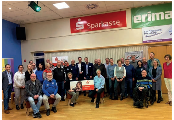
Die anwesenden Vereinsvertreter freuen sich über die Unterstützung aus dem SFF 2025