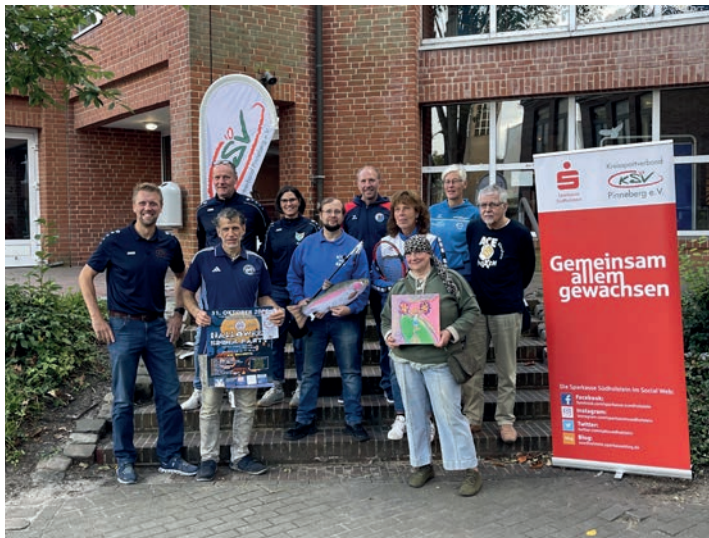
Vorbereitungstreffen für die SJKW 2025.

Ein besonderer Dank geht an die Sparkasse Südholstein sowie die Sportjugend Schleswig-Holstein, die dieses einzigartige Projekt in 2025 erneut tatkräftig unterstützt und so dazu beigetragen haben, dass die beteiligten Vereine unter Berücksichtigung der Eigenmittel der Sportjugend des KSV Pinneberg mit insgesamt 8.000,- € gefördert werden konnten.