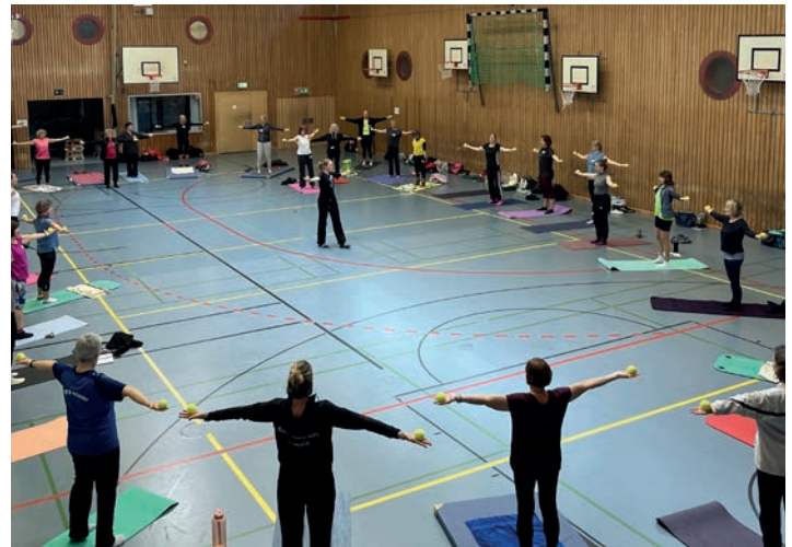
Der KSV Pinneberg bietet zahlreiche Lehrgänge zum Lizenzerwerb und zur -verlängerung an.

Die unter Pkt. 1 aufgeführte Förderung steht allen Vereinen im KSV Pinneberg zu, auch wenn der Verein keine Übungsleiter beschäftigt. Daher sollte jeder Verein grundsätzlich den entsprechenden Antrag fristgerecht einreichen, um sich die entsprechenden Fördergelder zu sichern.