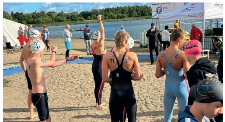
Die Freiwasserschwimmer des EMTV kämpften bei den Deutschen Meisterschaften in Rostock um Medaillen.

Bei Fragen zur Meisterschaftsförderung hilft das Team des KSV gerne persönlich oder telefonisch weiter.