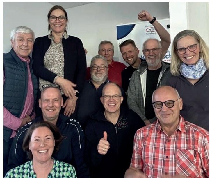
Der KSV-Vorstand und das KSV-Geschäftsstellenteam haben gemeinsam an der Entwicklung des Schutzkonzeptes gearbeitet

Das Schutzkonzept ist für alle einsehbar auf der KSV-Homepage/Kinder- und Jugendschutz-im-Sport.