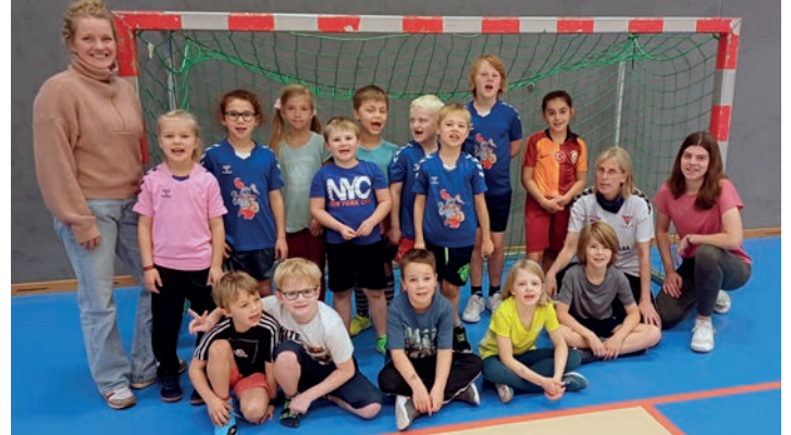
Begeisterter Nachwuchs beim Handball-Camp des BMTV

Safe Sport Code auf ihren Mitgliederversammlungen zum Beschluss vorzulegen, mit dem Ziel, ihn in ihren Satzungen zu verankern. Der Landes-sportverband und die DSJ werden dazu in der nächsten Zeit weitere Informationen an die KSVs und Vereine geben. Wer sich vorab dazu informieren möchte, kann dies auf der KSV Pinneberg - Homepage unter Kinder- und Jugendschutz tun oder auf der DOSB-Homepage unter Safe Sports Code. Für Beratung und Informationen zum Thema Kinder- und Jugendschutz stehe wir allen gerne zur Verfügung.