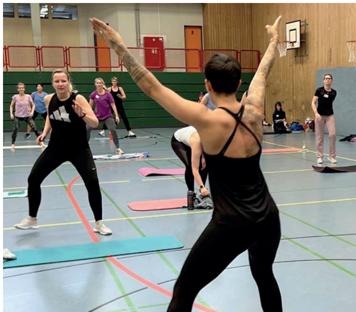
Übungsleiterlizenzen werden vom KSV mit 300,- € jährlich bezuschusst