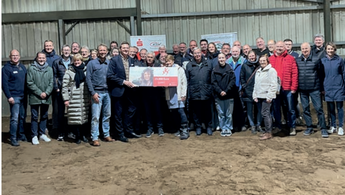
Die Vereinsvertreter freuen sich über die Zuschüsse aus dem SportFörderFonds

Folgende 31 Vereine erhielten in 2024 Zuschüsse: TTC Elmshorn, Reitverein Binnendiek, Sport & Spaß Uetersen, Wassersportverein Neuendeich, BMTV, TSV Neuendeich, BC Wedel, SSG Schenefeld, LSV Kreis Pi, SG Kölln-Reisiek, SuS Waldenau, TSV Uetersen, TuS Appen, VfL Pinneberg, TC Prisdorf, Elmshorner Ruder-Club, TSV Seestermüher Marsch, TSV Prisdorf, SC Egenbüttel, EMTV, 1. Handballclub Quickborn, Eisstock-Club Klein Nordende, SC Rist Wedel, TSV Gut Heil Heist, SSV Rantzaue, Schützenverein Tornesch, TuS Borstel Hohenraden, TuS Hasloh, SV Rugenbergen, Judo Club Elmshorn, Tennisverein Uetersen