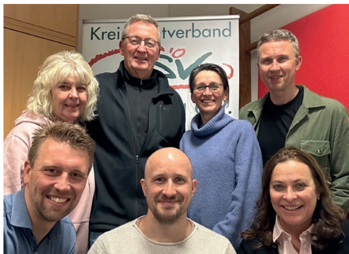
Dankeschön KSV Lehrteam

Das stets aktualisierte gesamte Aus- und Fortbildungsprogramm ist auf der KSV-Homepage unter der Rubrik Bildung/Bildungsprogramm zu finden. Wir freuen uns immer auf motivierte und engagierte Teilnehmerinnen und Teilnehmer aus der großen Sportfamilie.