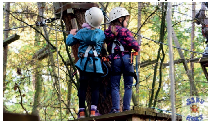
Hoch hinaus ging es beim SV Hörnerkirchen

Pressekonferenz SJKW 2025: 01.10.2025 (Einladung an teilnehmende Vereine erfolgt gesondert)