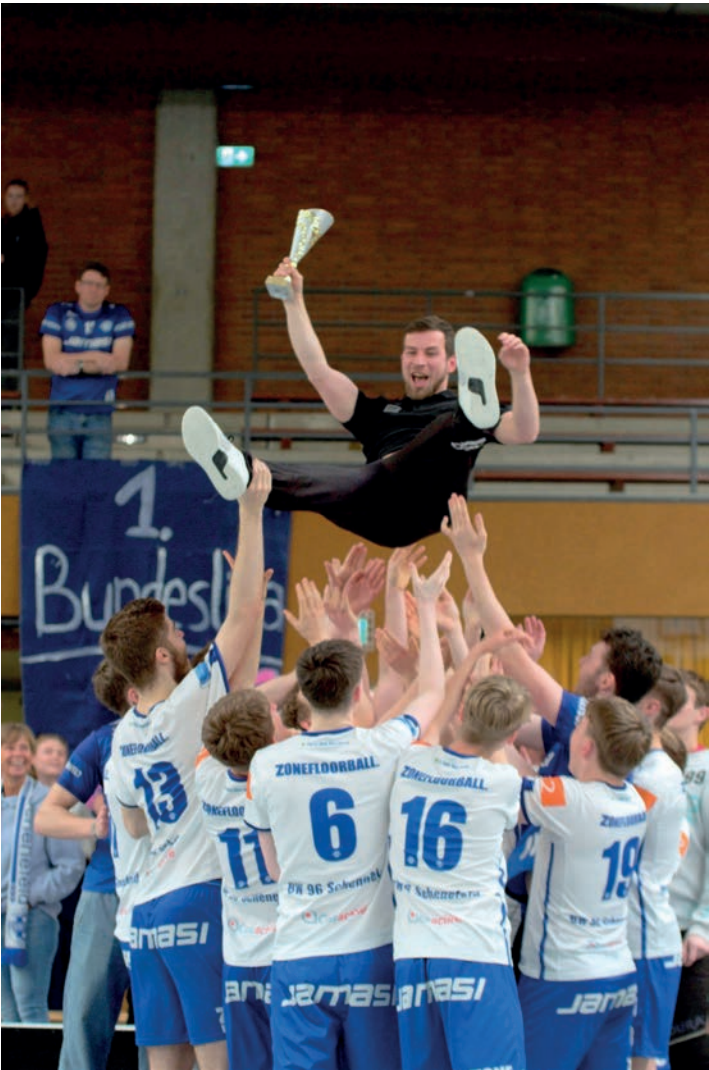
Die Floorballer von Blau Weiß 96 Schenefeld freuen sich über den Meistertitel in der 2. Bundesliga

Das Antragsformular sowie die Richtlinie in der gültigen Fassung sind auf unserer Homepage unter der Rubrik „Zuschüsse“ verfügbar. Die Höhe der Fördersätze bleibt im Vergleich zum Vorjahr unverändert. Bei Fragen hilft das Team des KSV auch gerne persönlich oder telefonisch weiter.