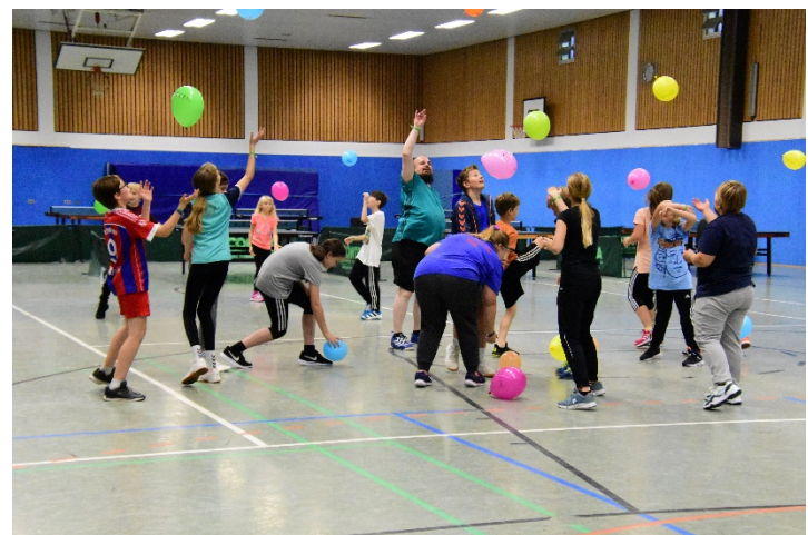
SJKW 2021 - mit ganz viel Spaß & Motivation ein Angebot vom SV Hörnerkirchen