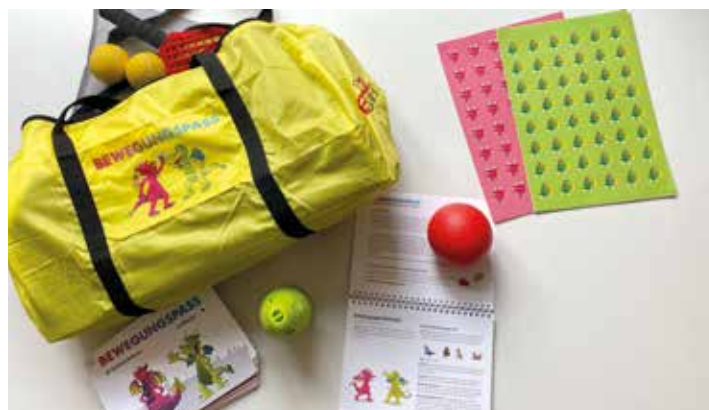
Vereine, die teilnehmen, erhalten neben den kostenfreien Schulungen auch die kostenlose Materialtasche. Der LSV Innovationsfonds förderte das Projekt in der Entwicklungsphase.