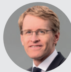
Daniel Günther, Ministerpräsident von Schleswig-Holstein:

Bei den jüngst veröffentlichten Zahlen des BKA und der Kriminalstatistik der Landespolizei S.-H. möchte man sich erschrocken die Augen reiben. Es geschieht, sogar tagtäglich: Den Schutzbedürftigsten in unserer Gesellschaft wird Gewalt angetan. Vor allem das Pandemie-Geschehen hat die Situation der Opfer verschärft: Während der Kontaktbeschränkungen konnten ihre stillen Hilferufe noch weniger gehört werden. Auch ihre Blessuren wurden nicht wahrgenommen, weil Kitas und Schulen geschlossen waren und die Gewalt hinter verschlossenen Türen stattfand. 152 Kinder haben im vergangenen Jahr durch Gewalt ihr Leben gelassen, Tausende schlimmste Verletzungen an Körper und Seele erlitten.