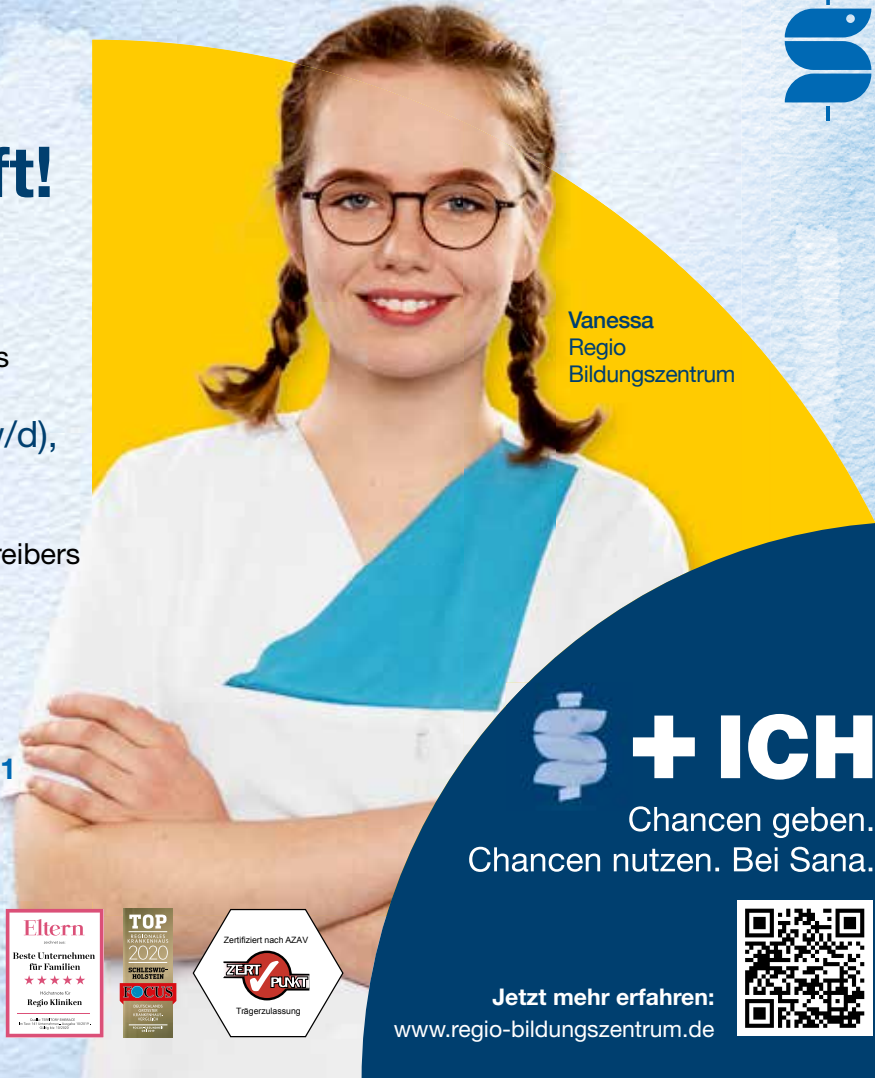
Vanessa Regio Bildungszentrum