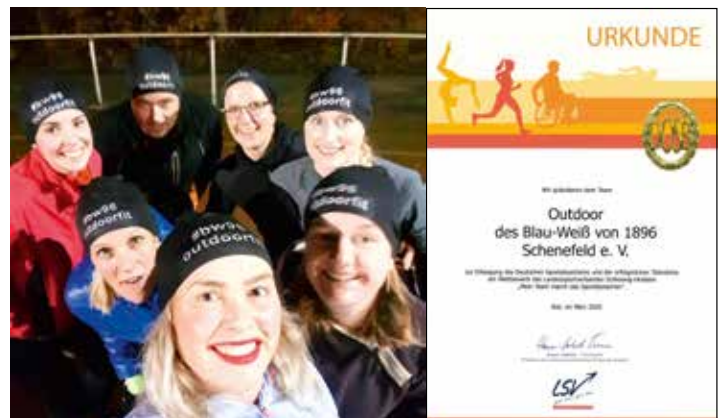
Ein Teil des Gewinner-Teams Outdoorfit des Vereins BW Schenefeld

2 Teams können sich über Geldpreise von jeweils 500 € freuen: