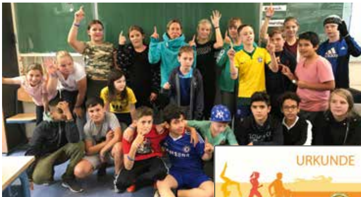
Die Gewinnerklasse der GuGs im Quellental anlässlich des Lauftages im September 2019

Erneut hat der Landessportverband Schleswig-Holstein den Wettbewerb unter dem Motto „Meine Klasse macht das Sportabzeichen“ ausgeschrieben. Die Resonanz auf die Ausschreibung war riesig. 137 Klassen haben sich landesweit im Laufe der Sportabzeichen-Saison an dem Wettbewerb beteiligt, gemeinsam für das Deutsche Sportabzeichen trainiert und größtenteils die Bedingungen in ihrer Altersklasse erfolgreich absolviert. Im Kreis Pinneberg haben 27 Schulklassen teilgenommen. Dank der Förderung dieses Projektes durch die Sparkassen in Schleswig-Holstein, die das Deutsche Sportabzeichen in vielfältiger Weise unterstützen, kann sich die 8e der Elsa-Brändström-Schule, die 6a der Grund- und Gemeinschaftsschule im Quellental und die Klasse 3a der Moorwegschule in Wedel über einen Geldpreis in Höhe von je 500 Euro für die Klassenkasse freuen.