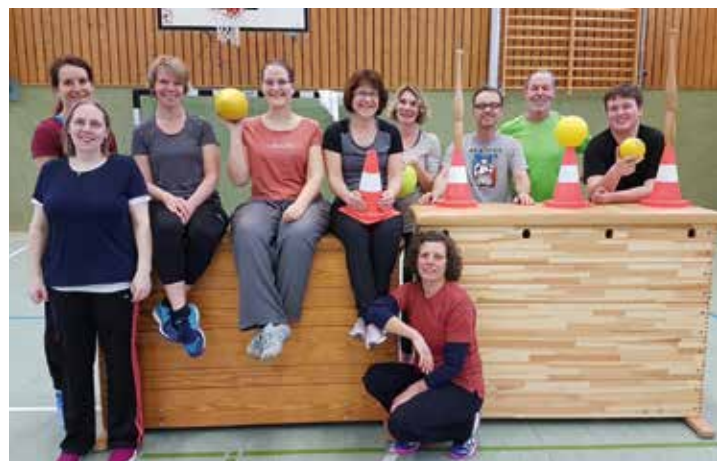
120 Stunden büffeln lohnten sich.