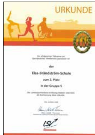
350 € für die Elsa-Brändström-Schule in Elmshorn

Im Wechsel mit dem Vereinswettbewerb fand im Jahr 2019 wieder der Schulwettbewerb statt, jedoch diesmal letztmalig. 50 Schulen aus Schleswig-Holstein haben sich an dem Wettbewerb beteiligt. Im Kreis Pinneberg können sich die Moorwegschule Wedel sowie die Elsa-Brändström-Schule über einen Geldpreis freuen.